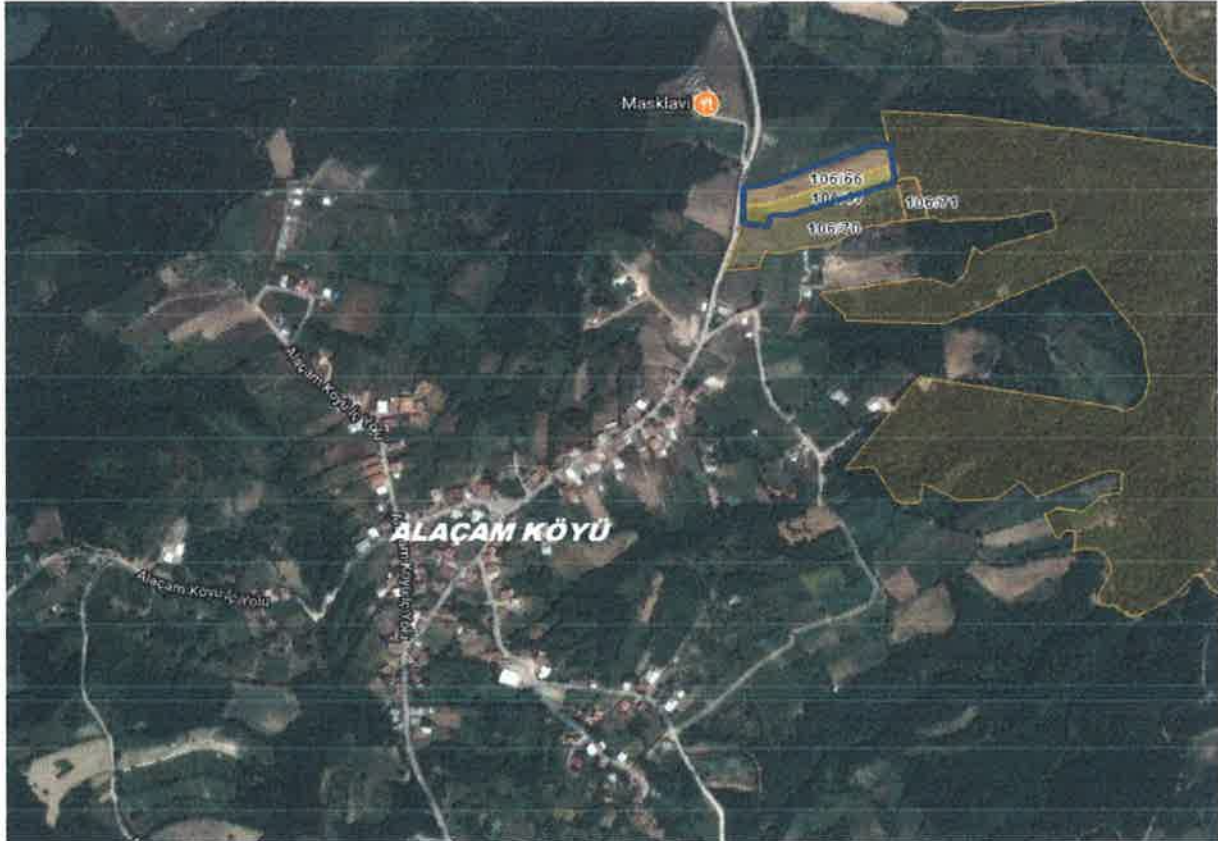
66-67 Parsel Hava Fotoğrafı

3-PLANLAMA BÖLGESİ: Plan değişikliği yapılan 106 Ada 66-67 parseller; Kestel İlçe merkezinin güney doğusu yönünde, Alaçam Mahallesi'ne 690 m, ilçe merkezine kuş uçuşu yaklaşık 10.5 km, Bursa İl Merkezine Kuş uçuşu 29 km mesafede yer almaktadır.